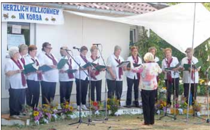
Chortreffen in Körba 2018