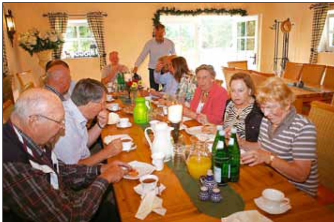
Besuch aus Brasilien