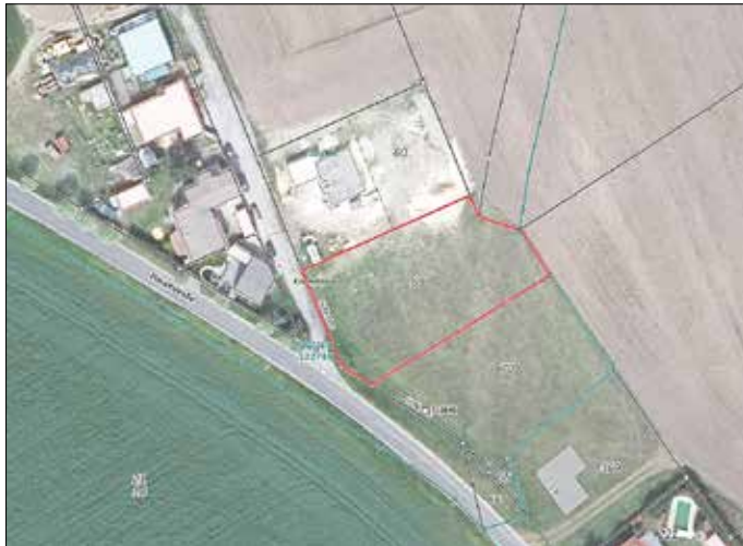
© Amt Schlieben 2026 | © GeoBasis-DE/LGB 2026, dl-de/by-2-0

Ansprechpartner für Rückfragen ist Frau Kirschner, Abt. Liegenschaften, unter der Telefonnummer 035361 356-20.