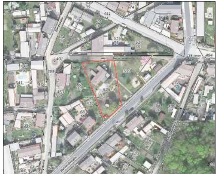
© Amt Schlieben 2026 | © GeoBasis-DE/LGB 2026, dl-de/by-2-0

Ansprechpartner für Rückfragen ist Frau Kirschner, Abt. Liegenschaften, unter der Telefonnummer 035361/356 - 20.