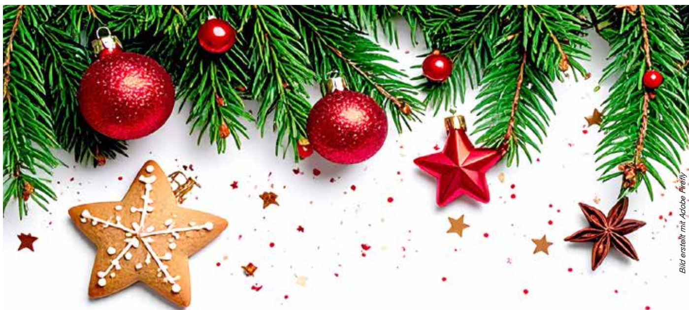
Bild erstellt mit Adobe Firefly