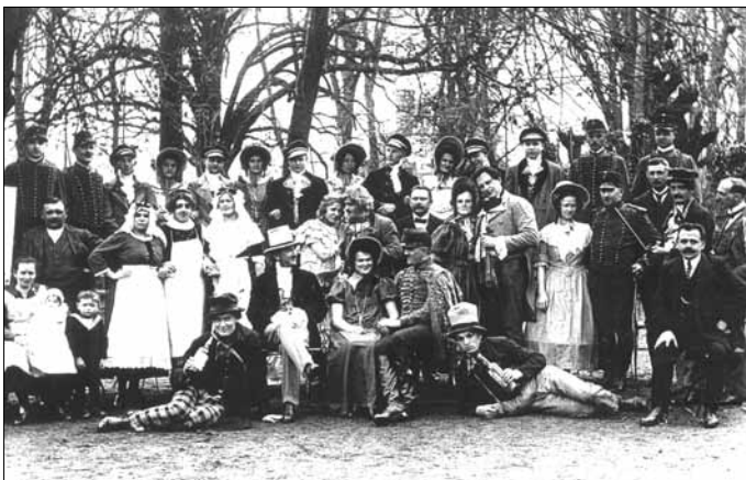
Theaterverein Schlieben