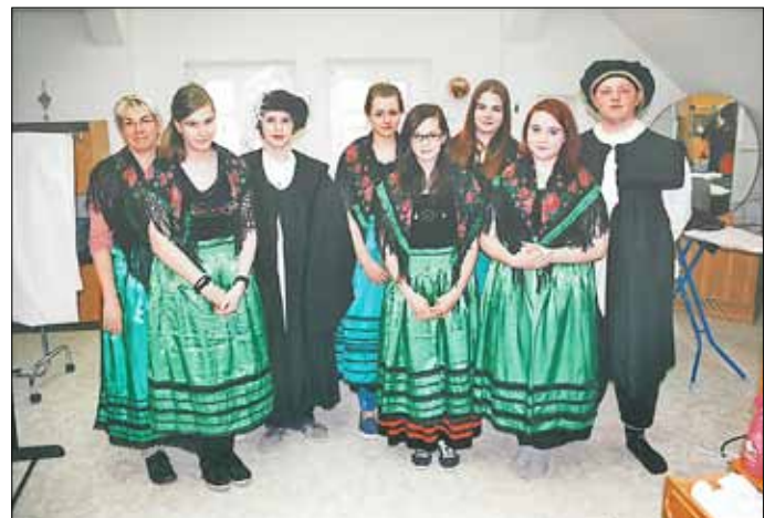
Schüler der Klassen 8 und 10 als Gästeführer

Beiliegend: Amtsblatt für das Amt Schlieben und die amtsangehörigen Gemeinden Fichtwald, Hohenbucko, Kremitzau, Lebusa und die Stadt Schlieben - Amtlicher Teil