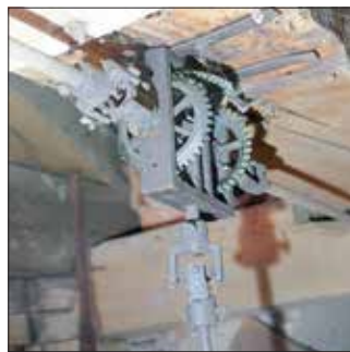
Übertragungsgetriebe zu den Zifferblättern

Wichtig für das einwandfreie Funktionieren des Uhrsystems ist ebenfalls die Pflege des im Bild gezeigten Getriebes mit Kegelzahnradern, das die Drehung der vom Uhrwerk kommenden vertikalen Welle auf die horizontal zu den großen Zeigern der Zifferblätter führenden Wellen überträgt. Die Zifferblätter befinden sich auf der Ost- und der Westseite des Turms.