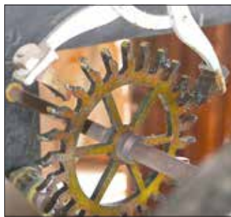
Anker und Hemmungsrad im Detail

Wichtig für das einwandfreie Funktionieren des Uhrsystems ist ebenfalls die Pflege des im Bild gezeigten Getriebes mit Kegelzahnradern, das die Drehung der vom Uhrwerk kommenden vertikalen Welle auf die horizontal zu den großen Zeigern der Zifferblätter führenden Wellen überträgt. Die Zifferblätter befinden sich auf der Ost- und der Westseite des Turms.