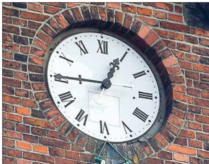
Blick vom Ratskeller auf die nach Westen gerichtete Turmuhr

Bei dem von außen aufgenommenen Bild des gleichen Zifferblattes sieht man andeutungsweise die Revisionsluke sowie die weißen Teile der Zeiger, die einem genauen Austarieren der Drehmomente der schwarzen Zeigerhälften dienen.