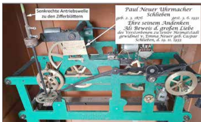
Altes im umgebauten Zustand stillgelegtes Turmuhrwerk

Vom Uhrwerk führte über mehrere Etagen eine vertikale Welle zu einem in der Höhe der Zifferblätter befindlichen Getriebe mit Kegelezahnrädern, von dem aus horizontale Wellen die Minutenzeiger der vier Zifferblätter antrieben. Unmittelbar vor den Zifferblättern befand sich an diesen Wellen jeweils ein Gegengewicht, das die Drehmomente der großen Zeiger kompensierte. Darüber hinaus sorgten dort auch Untersetzungsgetriebe 1:12 für den Antrieb der Stundenzeiger. Bei korrekter Synchronisation von Uhrwerk und Zeigerstellungen ließen sich bei den Pendeluhrn leichte Zeitkorrekturen durch eine kurzzeitige Veränderung der Schwingungszeit des Pendels vornehmen.