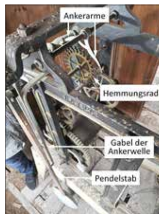
Turmuhrwerk in Lebusa

Im Kirchturm von Lebusa befindet sich ein Turmuhrwerk der Firma J. F. Weule aus Bockenem, das vermutlich seit 10 Jahren nicht mehr in Betrieb gewesen ist. Hier sind beim Blick von oben das Pendel, die beiden hellen Arme des Ankers und das Hemmungsrad gut zu sehen. Der leichte hölzerne Pendelstab hängt beweglich an einem dünnen Metallstreifen (Federlagerung). An seinem unteren Ende befindet sich die schwere Pendellinse. Die Bewegung des Pendels wird mit einer im Pendelstab stecken-