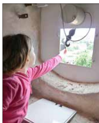
Rückseite eines der neuen Zifferblätter bei geöffneter Revisionsluke

Da sich das mechanische Übertragungssystem zur Zeitanzeige in einem sehr schlechten Zustand befand, erfolgte mit Beginn der Renovierungsarbeiten in der Kirche Anfang der 1990er Jahre auch die Installation einer funkgesteuerten Hauptuhr und von vier von kleinen Motoren angetriebenen Zeigertriebwerken hinter den Zifferblättern. Die Signalübertragung geschieht dabei über elektrische Leitungen.